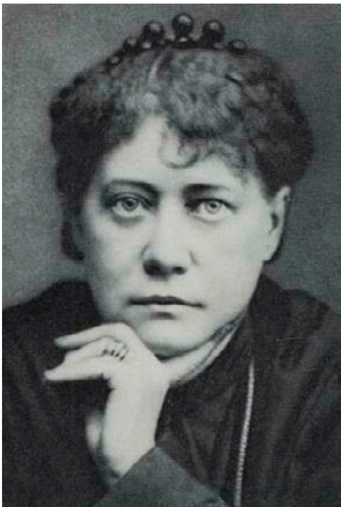
Helena P. Blavatsky i 1877. Ved oppstart av Uranus/Pluto-syklusen i 1848 startet Blavatsky en verdensomspennende reise på jakt etter gammel, esoterisk visdom. Denne kunnskapen spredte hun i hele den vestlige verden ved Uranus/Pluto-kvadraturet på 1870-tallet. Hun stiftet da Teosofisk Selskap og publiserte "Isis Unveiled". Dette ga også viktige impulser til hippiebevegelsen ved Uranus/Pluto-konjunksjonen på 1960-tallet, og til våre dagers "New Age".

parlamentarisme, og kamp for medbestemmelse, demokrati og arbeidernes rettigheter. Nedgangstiden i 1873-1879 var et begrenset tidsavsnitt innenfor en lang epoke med formidabel vekst på nesten alle områder. Denne veksten hadde sitt utgangspunkt i Den teknologiske revolusjon, som altså fant sted ved Uranus/Pluto-konjunksjonen i 1850-1851 .