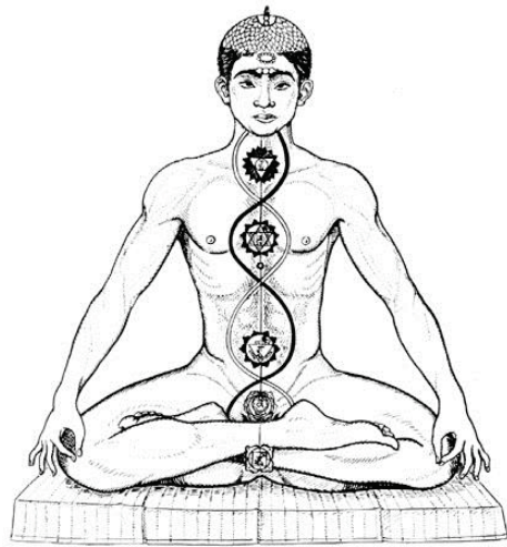
Chakrasystemet slik det presenteres i hinduismen.

Selskap, samt ordensselskapet The Hermetic Order of the Golden Dawn, som baserte seg på kabbalah. Den første boken som presenterte kabbalah på en likefrem og direkte måte for et offentlig publikum, var Dion Fortunes The Mystical Qabalah fra 1935. Denne klassikeren ble nylig utgitt på norsk med tittelen Kabbalah – Vestens mystikk , og vil kunne være en veiviser for dem som søker seg inn mot Vestens esoteriske tradisjon.