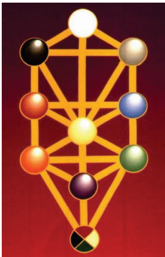
Livets Tre med de 10 sfærer og 22 stier

Livets Tre er det sentrale symbolet i kabbalah. Det er blant annet et kart over Skaperverket der både den fysiske og de oversanselige verdener er fremstilt.